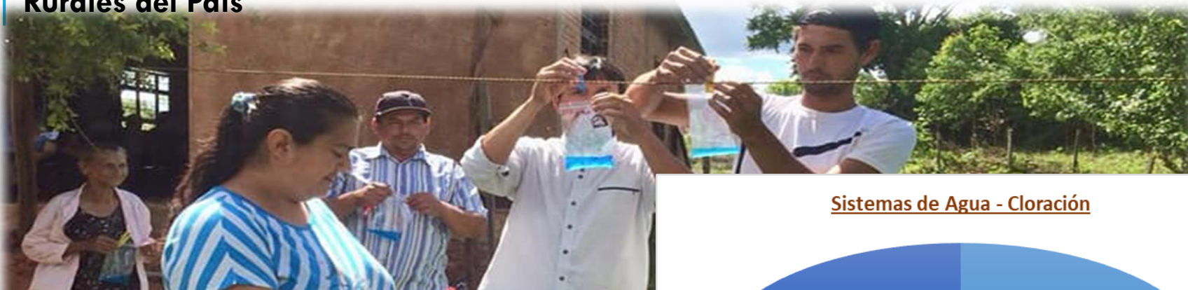
Sistemas de Agua - Cloración