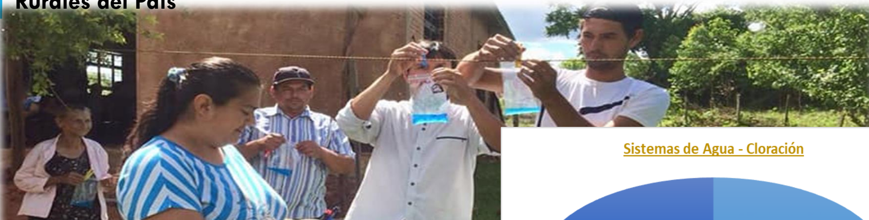
Sistemas de Agua - Cloración