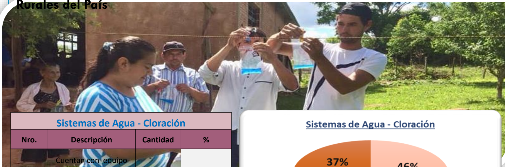
Sistemas de Agua - Cloración